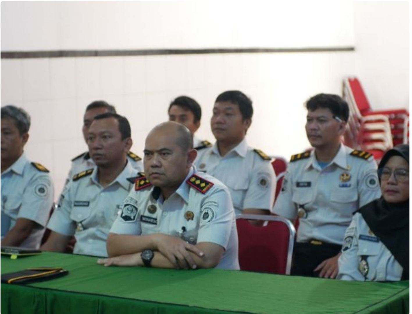
Lapas Kembang Kuning Ikuti Pengarahan Kesiapan Layanan Kunjungan Hari Raya Idul Fitri 1447 H

Cilacap – Dalam rangka mempersiapkan pelaksanaan layanan kunjungan Hari Raya Idul Fitri 1447 H, Lembaga Pemasyarakatan (Lapas) Kelas IIA Kembang